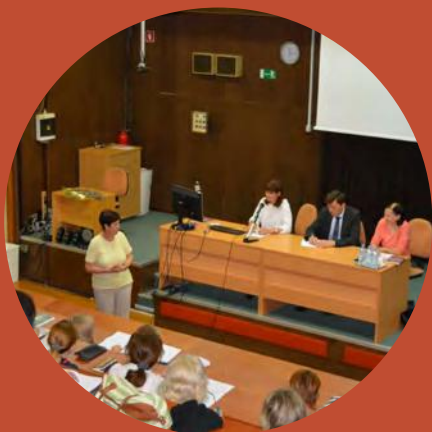
Ugotovljeno na spomladanskih posvetih o varnem in spodbudnem okolju bo predstavljeno na konferenci, ki bo predvidoma izpeljana novembra letos.

zaposlenim v šolah ne razkrije ali pa se počuti od njih nesprejete. Velja tudi, da so mlade LGBTIQ+ osebe najbolje sprejete med sošolkami in sošolci, čeprav doživljajo z njihove strani tudi nasilje. Po mnenju mladih bi učitelji in šole lahko pomembno izboljšali življenje LGBTIQ+ oseb v Sloveniji, v razpravi na posvetu pa so pripravili predloge za izboljšave na tem področju: več pozornosti bi namenili dostopnosti kontaktov, ki bi bili na voljo tistim, ki bi se znašli v stiski, v šolski hišni red bi vključili prepoved diskriminacije na podlagi spolne usmerjenosti in/ali spolne identitete, pogrešajo delavnice nenasilne komunikacije, šolsko svetovalno službo bi radi videli kot varen prostor za LGBTIQ+ osebe. Predvsem bi radi, da se dijake seznanijo, da so tudi LGBTIQ+ osebe na šoli dobrodošle, in da postane šola varen prostor za prav vse dijakinje in dijake.