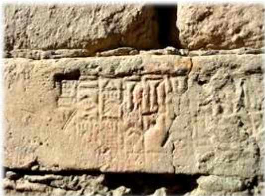
fotografija iz Iraka leta 2013