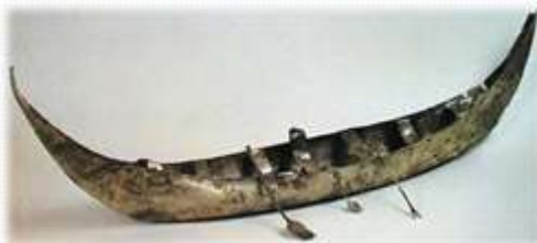
čoln iz obdobja Sumercev

sumerska harfa, ki je bila osnova za današnjo harfo, stara cca. 4750 let (na ta inštrument je igrala sumerska kraljica Šbad)