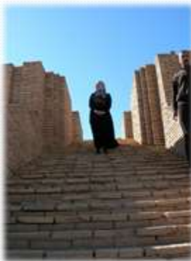
stopničasta piramida Zigurat

Mesto Ur je bilo glavno mesto starodavne civilizacije Sumerija ter prvo zabeleženo mesto na svetu, ki je predstavljalo začetek civilizacije na našem planetu.