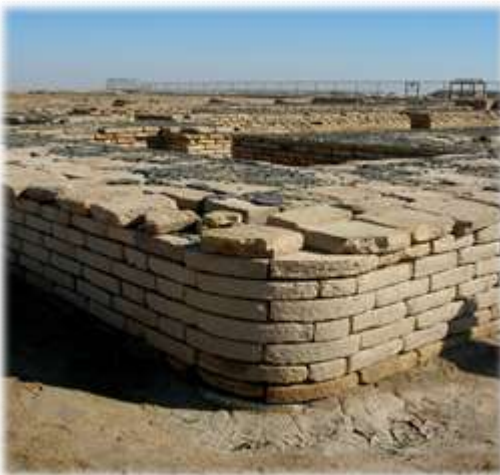
prva krožna oblika gradnje in strešna kritina iz smole in delov palme