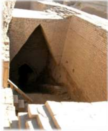
prva zasnova za strop