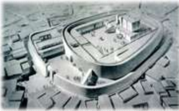
rekonstrukcija sumerskega templja (arhitektura)