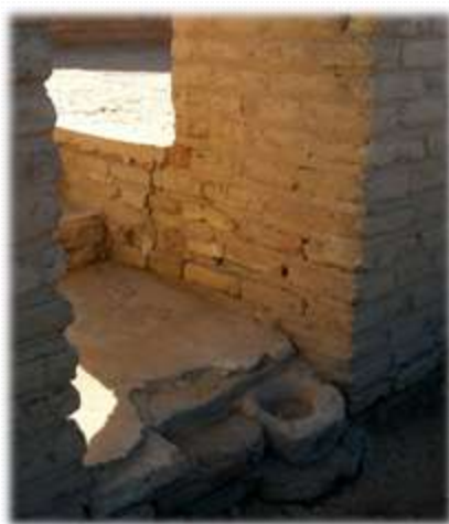
prvi tečaj za odpiranje vrat