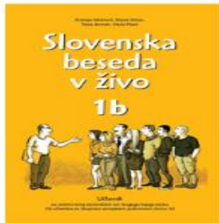
Slovenska beseda v živo 1b