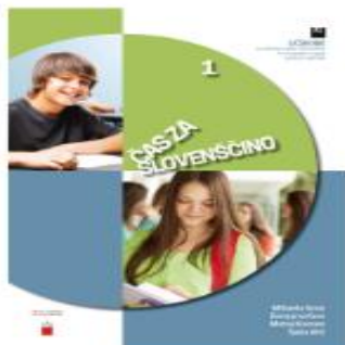
Čas za slovenščino 1