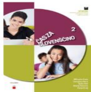
Čas za slovenščino 2