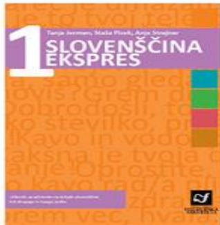
Slovenščina ekspres 1