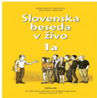
Slovenska beseda v živo 1a