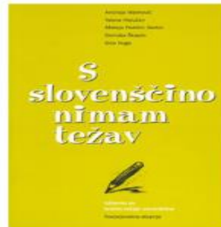
S slovenščino nimam težav