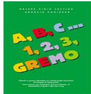
A, B, C, ... 1, 2, 3, gremo – za govorce albanščine