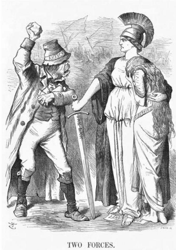
5. Anti-Irish cartoon ( Punch 29 October 1881)